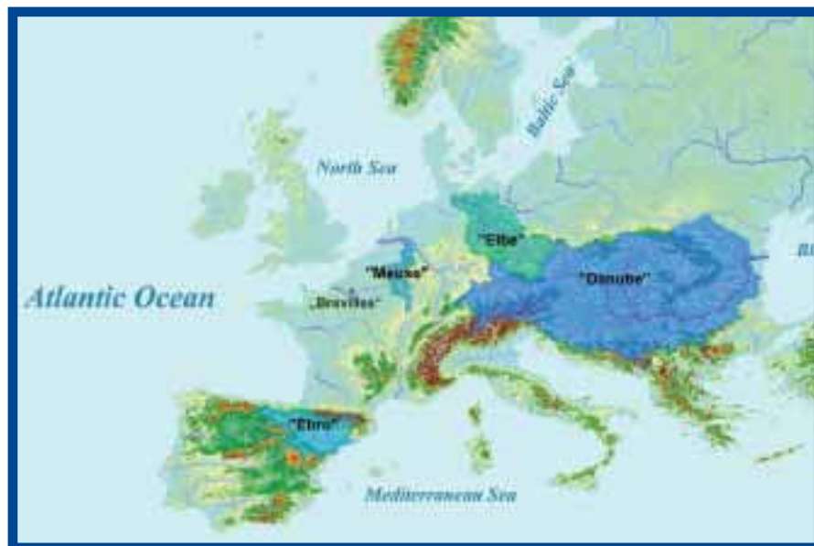
Afb. 1: Binnen AquaTerra bestudeerde riviersystemen.

Het zesde Europese Kaderprogramma-onderzoeksproject AquaTerra (2004-2009) probeert via een multidisciplinaire aanpak beter te begrijpen hoe verontreinigingen zich gedragen in Europese riviersystemen zoals de Maas, Donau, Elbe en Ebro. Enkele tot nu toe verkregen resultaten die voor Nederlandse waterbeheerders relevant zijn, worden hier vernoemd. Deze resultaten pleiten voor risicogestuurd beheer van de verontreinigingen, waarbij het benutten van de natuurlijke veerkracht van het riviersysteem centraal staat. AquaTerra geeft meer inzicht in de potentie van veerkracht als beheerinstrument.