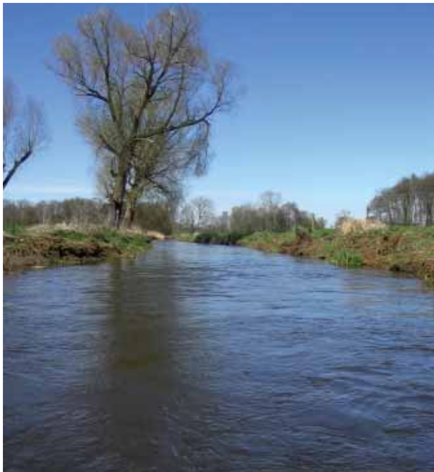
De Dommel, deel van het stroomgebied van de Maas (foto: Jessica Thomas/Stefan Jansen).

biologische beschikbaarheid van verontreiniging in water, sediment en/of grond kan worden geschat. Op basis daarvan kan een betere inschatting worden gemaakt van het risico van verontreinigingen voor de ecologie in riviersystemen.